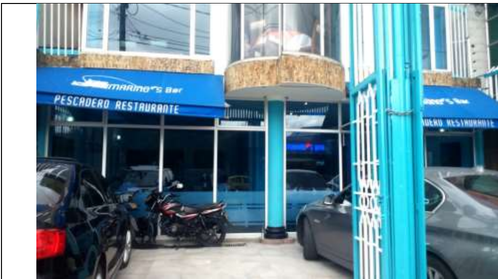
Fotografía No. 1: Establecimiento PESCADERO RESTAURANTE MARINO'S BAR, ubicado en la Calle 116 No. 60-61

Registro fotográfico, Visita No. 2 efectuada el día 07-07-2015