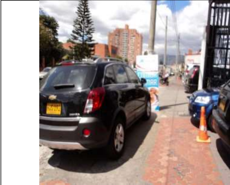
Fotografía No. 2: Elemento en espacio público del establecimiento PESCADERO RESTAURANTE MARINO'S BAR, ubicado en la Calle 116 No. 60-61